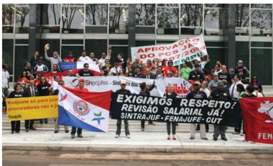
Manifestação em frente ao STF, ocorrida no dia 28/09

Entretanto, alguns analistas apontam fatores positivos nessa conjuntura. O primeiro é o fato de que a nota também ressalta que existem os projetos que, devido à autonomia orçamentária dos poderes e órgãos de origem, não poderiam deixar de ser considerados na proposta orçamentária para 2011. Isso pode criar